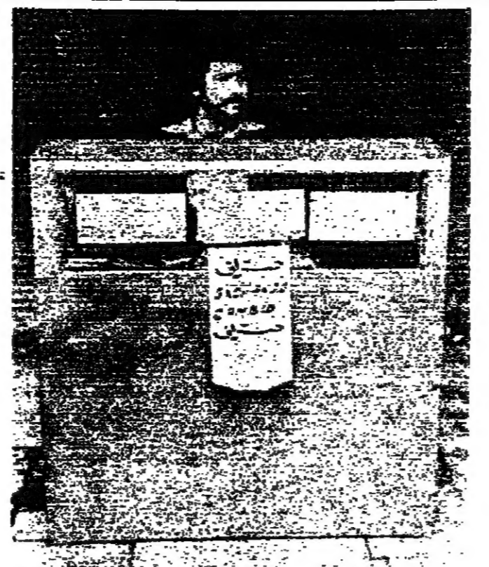
مراقب في بيروت ينتظر من يصره

توقفت امس عمليات توزيع المواد الغذائية والمحروقات بسبب اوضاع الامن المتدهورة ووقف اشيكاتك في قلب المنطقة الحضرية، مما أدى الى شلل المواصلات ووجود الحركة الاقتصادية في مختلف المناطق. واطمن مدير عام النطاق المهتمين محمد عبد عبيد الله لسمعة امس عمليات نقل المحروقات بالمصاريف حسب المادة، نظرا لتوقف الخزانات في محلة الثورة، واضاع سائقو